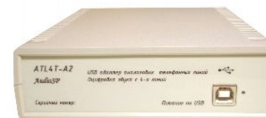
Рис. Вид сзади, розетка интерфейса USB BF

RJ11 (6P4C) контакты для подключения стандартной двухпроводной телефонной линии (полярность значения не имеет), подключение к линии в параллель (шнуром RJ11-RJ11 в двойник-разветвитель и далее к розетке, либо пайкой)