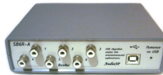
Рис. Вид спереди, входные разъемы RCA(f) – 6шт., выходная розетка USB BF.