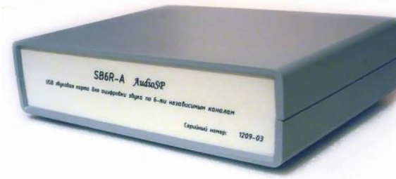
Рис. Вид сзади.